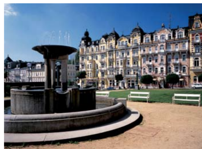
В Марианских Лазнях из-под земли бьют целебные родники, приносящие искрящуюся силу таинственных глубин Славковского леса.