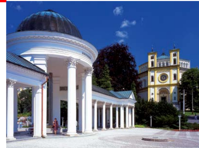
Марианские Лазни — прекрасный уголок чешской земли

Затем это горько-сладкий ликер для желудка «Карловарская бехеровка» (38% алкоголя, 10% сахара), известный под наименованием «тринадцатый источник», а для любителей сладостей — знаменитые на весь мир «курортные вафли», которые здесь начал производить Карл Байер примерно в 1850 г. И, конечно, нельзя не упомянуть о карловарском фарфоре (это и художественно-декоративные изделия, и посуда).