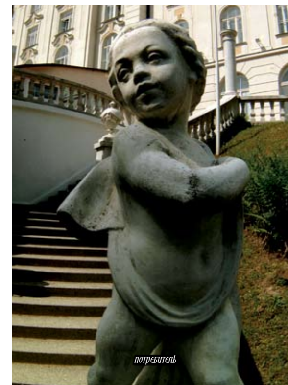
Яхимов, Радиум Палас