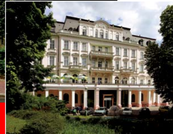
Теплице — Каменные Лазне

Основным средством лечения являются целебные источники, обнаруженные еще древними римлянами 2000 лет назад. Речь идет о благородной минеральной воде с температурой 39 °С, двууглекисло-натриевого типа с содержанием фторида и большого количества рассеянных элементов, в том числе и редких металлов. В настоящее время в Теплице лечатся болезни двигательного аппарата у детей и взрослых (артриты, артрозы, заболевания околосуставных мягких тканей, сколиоз, врожденные ортопедические пороки), заболевания сосудов, нервной системы (ДЦП, состояния после